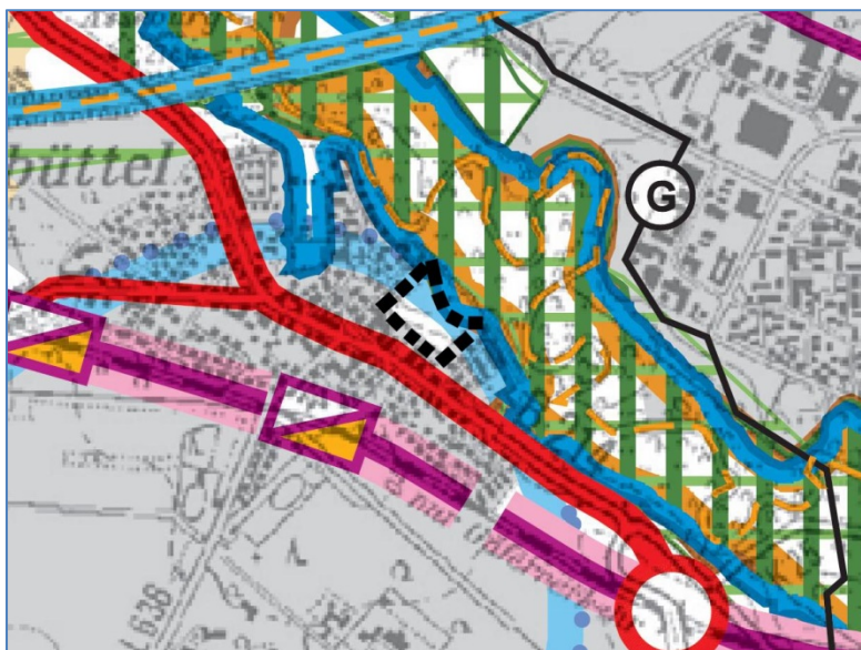
Abb. 1: Kartenausschnitt RROP, Kartenblatt Mitte-West Geltungsbereich 114. Änderung schwarz gestrichelt umrandet

Das RROP 2008 legt für den Geltungsbereich die Lage im „Vorbehaltsgebiet (Grundsatz der Raumordnung) Trinkwassergewinnung“ dar.