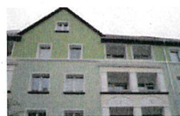
Die Virchowstr. 29,30,31 nach der Modernisierung mit den neuen Farben.