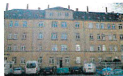
Kalandstraße 6-10 im Altbestand