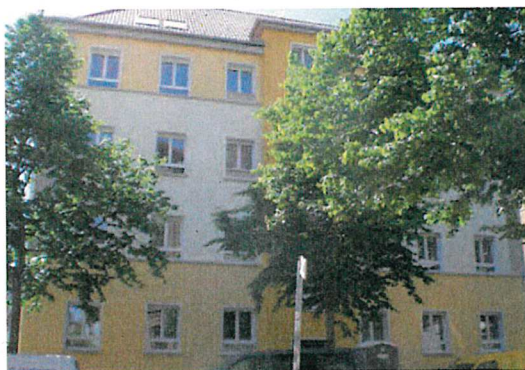
Die Kalandstraße 5 saniert