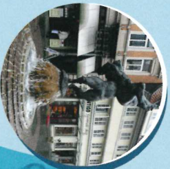
Ringerbrunnen (Station 28)