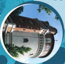
Wasserturm an der Hochstraße (Station 14)