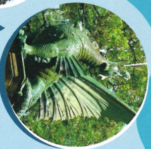
Detail des Heinrichsbrunnens auf dem Hagenmarkt (Station 5)

Der Braunschweiger Wasserweg wurde von Schülern und Schülern unserer Stadt recherchiert, dokumentiert und für Sie erstellt. Lernen Sie Braunschweig aus dem Blickwinkel des Wassers (neu) kennen und lassen Sie sich mitnehmen auf einem Weg, der die lokalen Wasserstationen immer wieder in einen globalen Kontext stellt. Lassen Sie sich herausfordern, überraschen und vor allem haben Sie Freude an unserem Wasserweg!