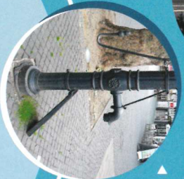
Wasserpumpe, Neue Strasse (auf dem Weg zwischen Station 28 und 29)

Der Braunschweiger Wasserweg startet und endet jeweils vor der Touristeninformation, Kleine Burg 14.