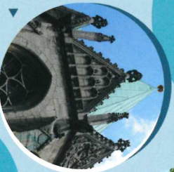
Wasserspeier an der Martinitirche (Station 24)