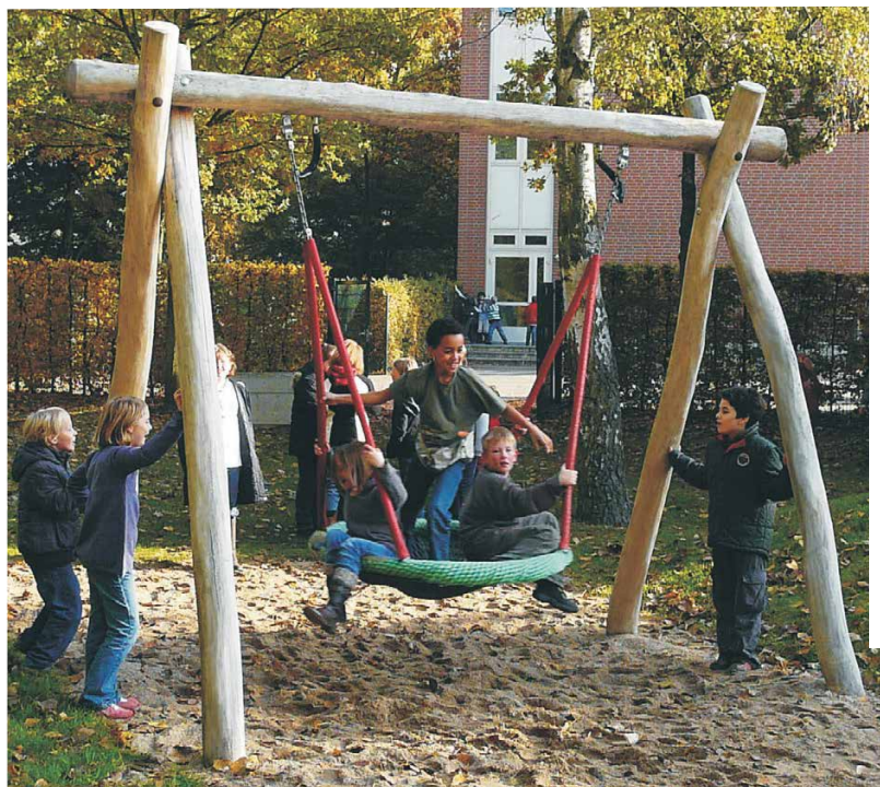
07.610.1 Nestkorbschaukel, LH250cm, Robinie