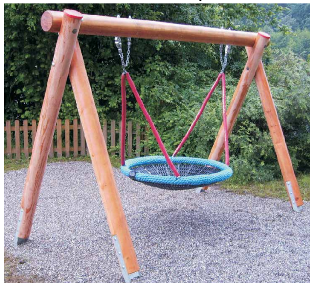
07.600.3 Nestkorbschaukel LH210cm, Lärche kg, mit Pfs