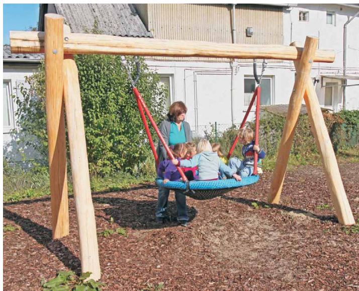
07.600.1 Nestkorbschaukel, LH210cm, Robinie