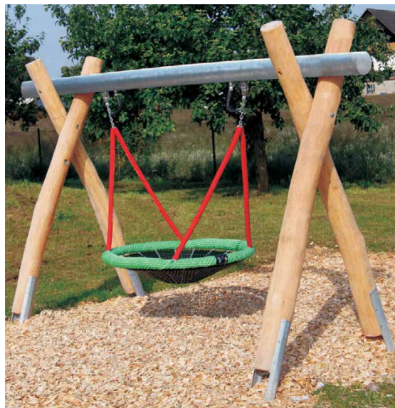
07.600.4 Nestkorbschaukel LH210cm, Robinie, mit Pfs, Abb. mit Stahlquerrohr vz (07.616.5)