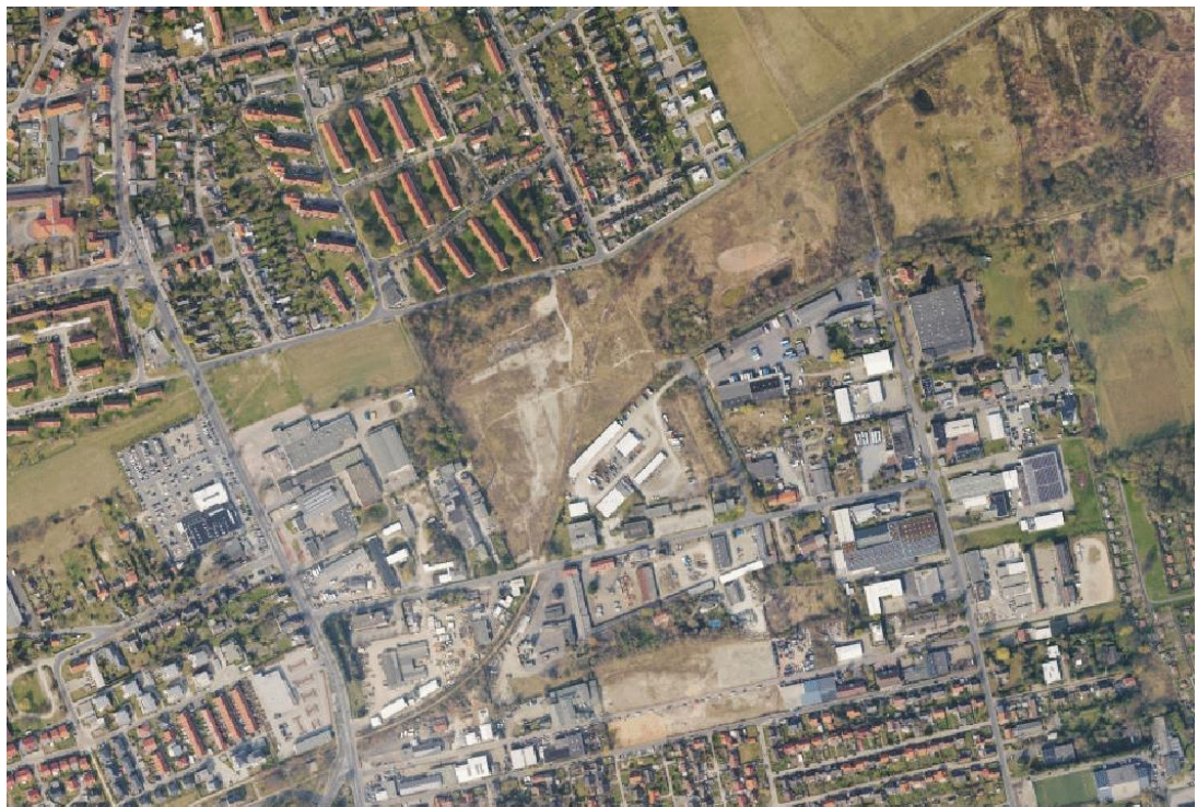
Luftbild Stadt Braunschweig, Fachbereich Stadtplanung und Umweltschutz, Abt. Geoinformation, 2014

Der Stadtteil Querum ist mit mehr als 6000 Einwohnern ein beliebter Wohnbereich in Braunschweig. Mit den infrastrukturellen Einrichtungen (Kindergärten, Grundschule, IGS Querum, Nahversorger, etc.) ist die soziale Infrastruktur für Wohnnutzung in sehr guter Ausstattung vorhanden. Die Anbindung des Stadtteils erfolgt mit den Buslinien 413, 433, 443. Damit ist eine gute Anbindung des Stadtteils an das ÖPNV-Netz gegeben. Weiterhin wird im Stadtbahnausbaukonzept die Anbindung Querums an das Stadtbahnnetz untersucht. Die Campusbahn (Nördliches Ringgebiet– Querum) ist bei den bisherigen Untersuchungen, zusammen mit einer Führung über die westliche Innenstadt, mit dem höchsten Potential aller untersuchten Korridore hervorgegangen. Somit besteht zusätzlich zur vorhanden Anbindung mit den Buslinien die Option einer Stadtbahn-Anbindung. Die gewählte Trasse wird in den Bauleitplanverfahren berücksichtigt.