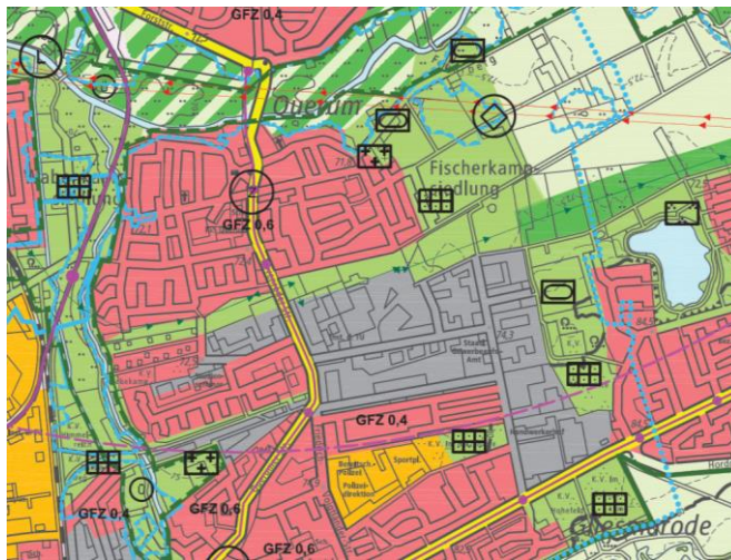
Kartengrundlage Amtlicher Stadtplan der Stadt Braunschweig, Fachbereich Stadtplanung und Umweltschutz, Abt. Geoinformation

Parallel zum Änderungsverfahren des FNP erfolgt die Aufstellung des Bebauungsplanes QU 62 „Dibbesdorfer Straße – Süd“.