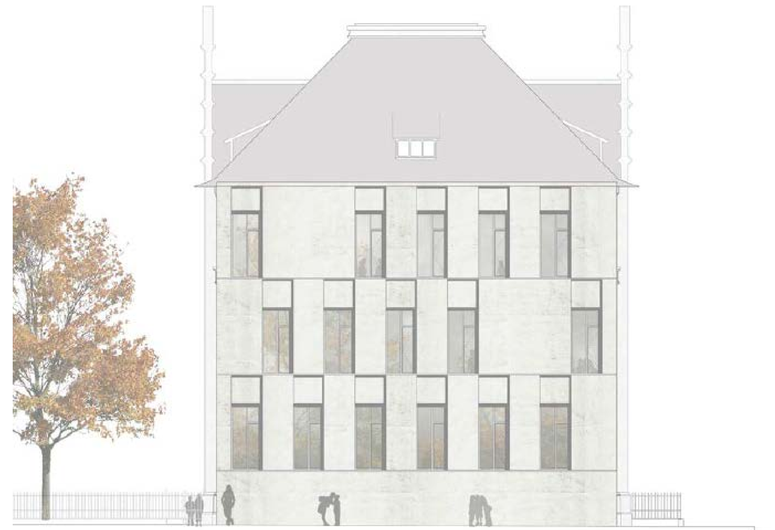
Schnitt / Ansicht Nord