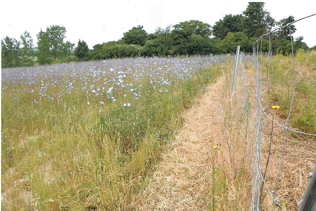
Zustand der Wiese im Juli 2018, mit Aspektbildner 'Wegwarte'