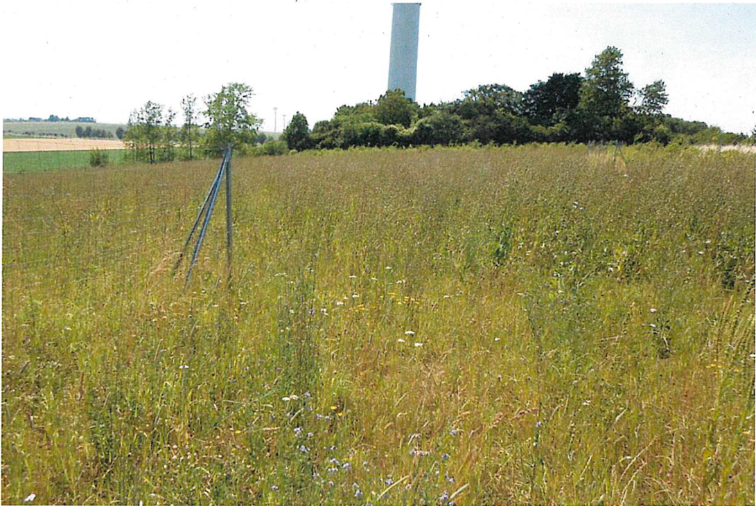
Mit Kräutern durchsetzte Wiese, Stand Juli 2019