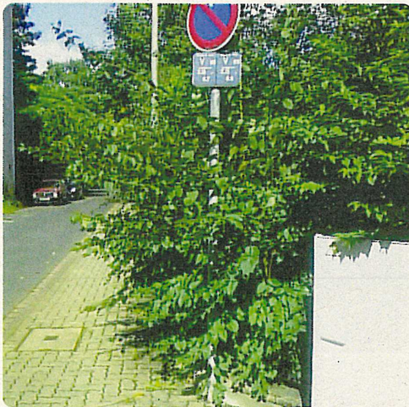
Dieser Gehweg ist durch wuchernden Bewuchs kaum passierbar.

Bitte beachten Sie schon vor dem Anpflanzen, welches Ausmaß Sträucher, Bäume und Hecken schon nach wenigen Jahren annehmen können. Entscheiden Sie sich für schwach wachsende Pflanzen oder halten Sie ausreichend Abstand zur Grundstücksgrenze. Die in Niedersachsen vorgeschriebenen Abstände zur Grundstücksgrenze finden Sie z.B. in der Broschüre zum Nachbarrecht in Niedersachsen (näheres s. Rückseite).