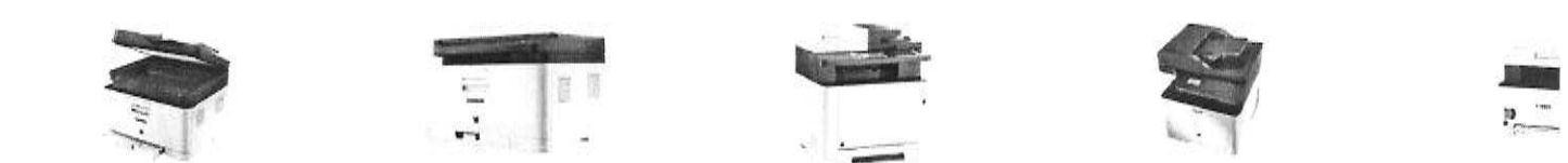
Samsung Xpress SL-C480FW, Samsung Xpress SL-C480W, KYOCERA Kyocera ECOSYS, Samsung Samsung CLX-6260FR, Canon Farblasere