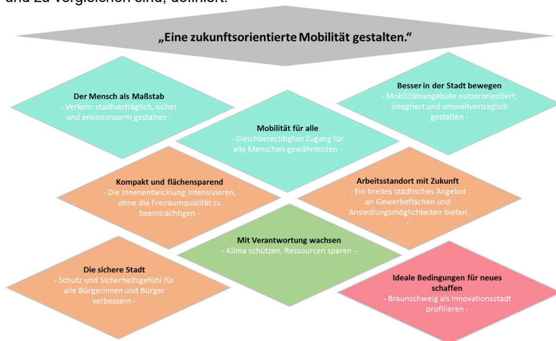
Abbildung 1: Fachübergreifende Strategien des ISEK mit Mobilitätsbezug (farbliche Unterteilung gemäß ISEK)

Um sicherzustellen, dass strategische Entscheidungen unter Berücksichtigung aller relevanter Belange zielgerichtet getroffen und die vielen Einzelthemen zu Mobilitätsfragen integriert für Braunschweig betrachtet werden, wurde unter Berücksichtigung der fachbereichsübergreifenden Strategien des beschlossenen ISEK eine Konkretisierung für den Bereich Mobilität vorgenommen. Im Ergebnis stehen die strategischen Zielfelder des MEP. Diese Zielformulierung bestimmt maßgeblich die Gesamtstrategie des MEP und bildet die Basis für die Chancen- und Mängelanalyse, die Festlegung des Zielszenarios, die Auswahl und Priorisierung von Maßnahmen sowie die abschließende Umsetzungsstrategie. So werden zum Beispiel auf Grundlage der strategischen Zielfelder des MEP die Bewertungskriterien und Indikatoren, mit denen die Szenarien und Maßnahmen zu bewerten und zu vergleichen sind, definiert.