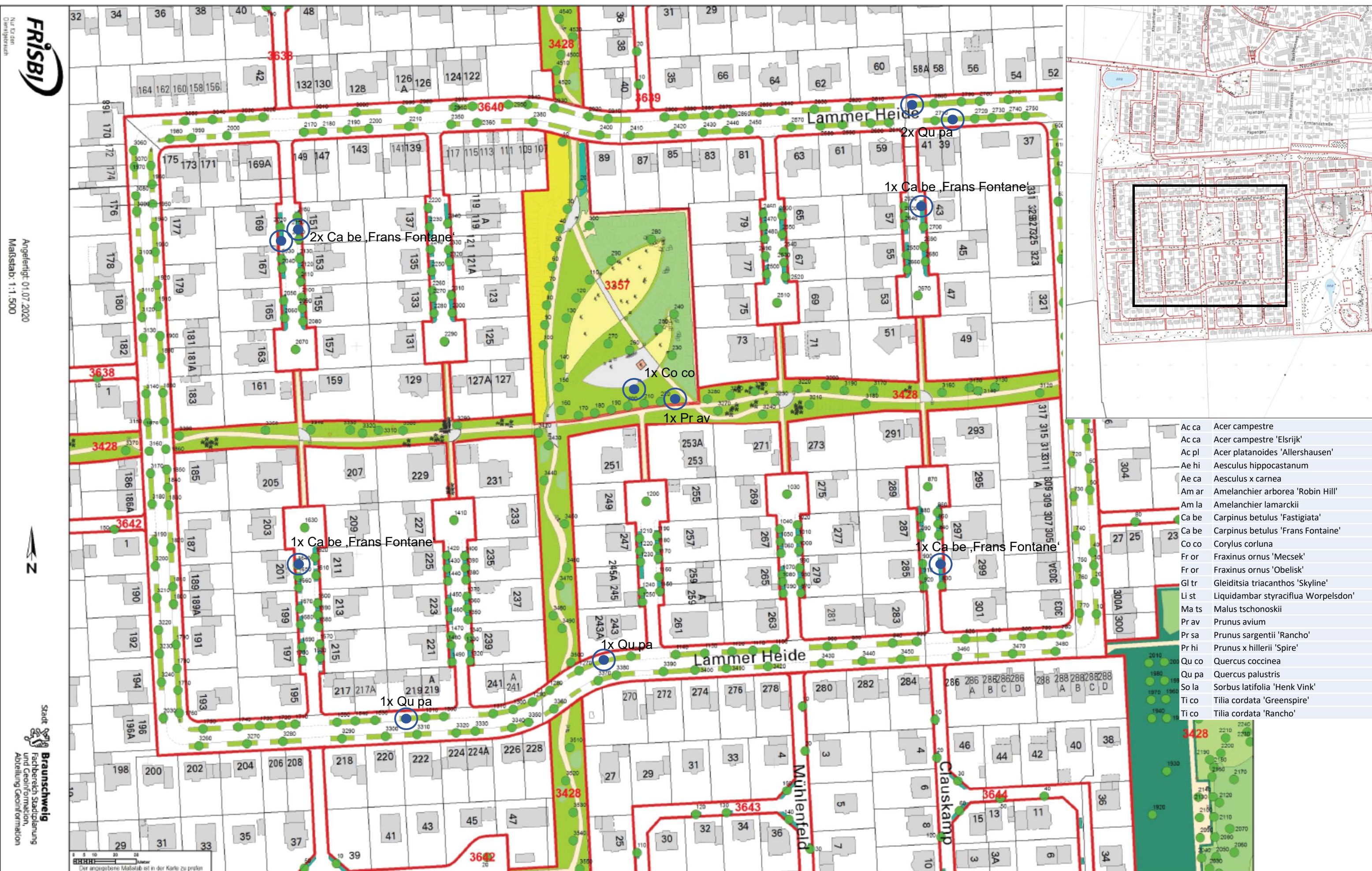
Ersatzpflanzung nach Sturmschäden III Stadtbezirk 321 Plan 321-4 M 1:1.500

Fachbereich Stadtgrün und Sport 67.21 SG 6 Datum: 20.08.2020 Bearbeitung: C. Weck