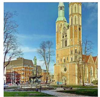
Abbildung 4 Ansicht des Brunnens auf dem Hagenmarkt

Wir danken für Ihre Mitwirkung und für Ihr Vertrauen in unsere Arbeit!