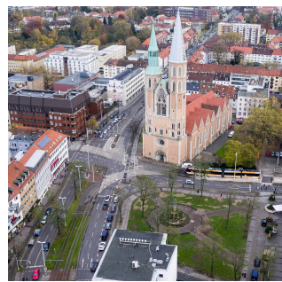
Abbildung 3 Der Hagenmarkt nach dem Sturm Xavier