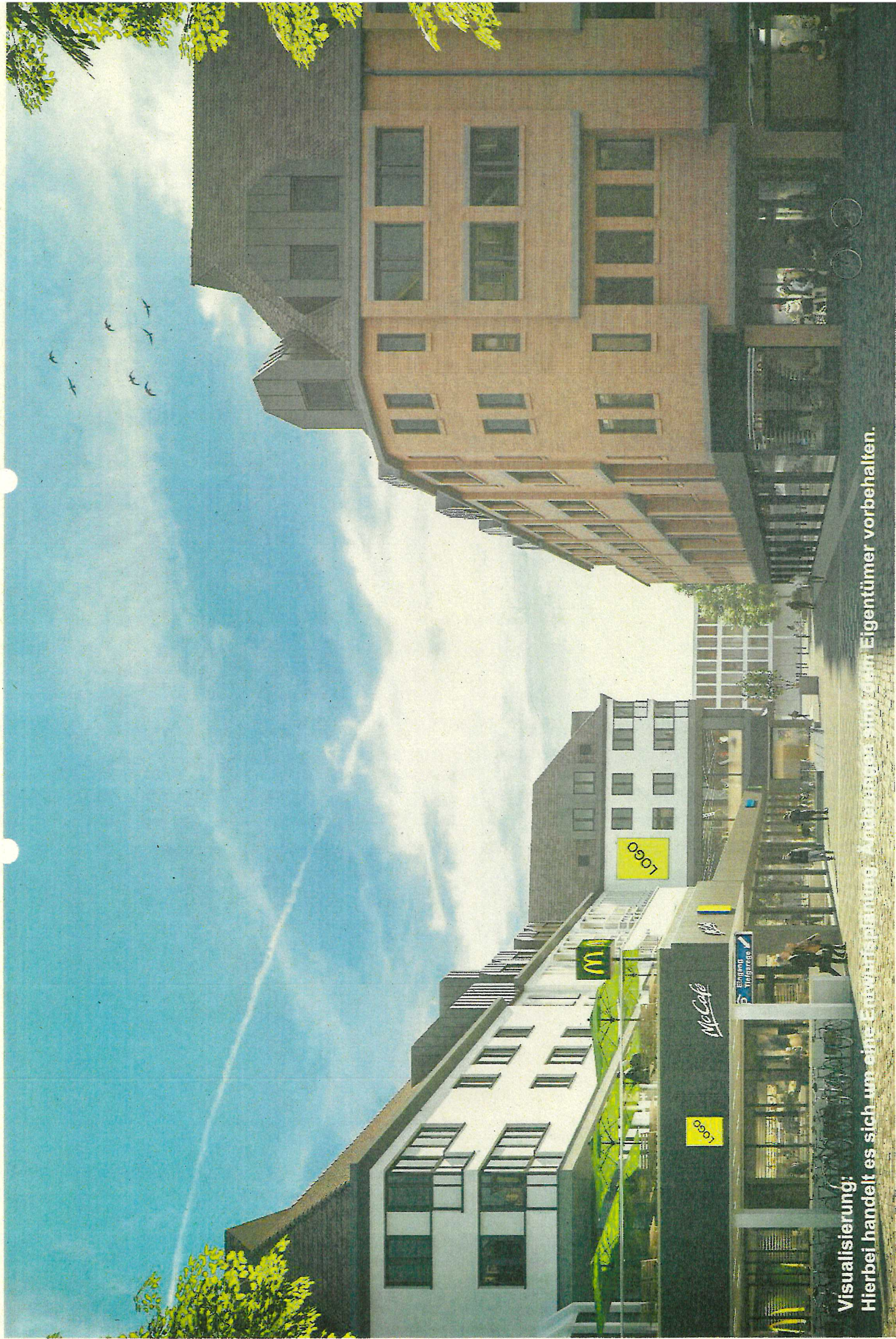
Visualisierung: Hierbei handelt es sich um eine Entwurfsplanung. Änderungen sind zum Eigentümers vorbehalten.