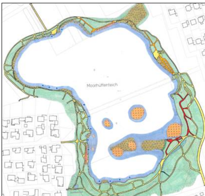
Abbildung 1: Moorhüttenteich Rückbau Wege/Trampelpfade

Diese umfassen Rückbau und Sperrung von Trampelpfaden zum Zwecke des Schutzes wertvoller Biotope (z. B. Schilfbestände) und zur Gewährleistung der Verkehrssicherheit (s. rot und orange markierte Pfade der Abbildung 1 ).