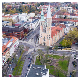
Abbildung 3 Der Hagenmarkt nach dem Sturm Xavier