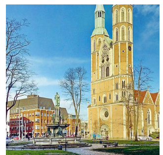
Abbildung 4 Ansicht des Brunnens auf dem Hagenmarkt

Wir danken für Ihre Mitwirkung und für Ihr Vertrauen in unsere Arbeit!