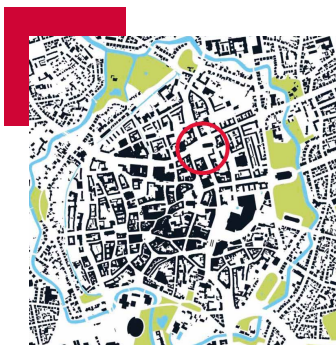
Abbildung 1 Lage des Hagenmarktes in der Innenstadt

Wir bitten Sie ganz herzlich, sich an dieser Befragung zu beteiligen. Die Beantwortung der Fragen wird ca. 15 Minuten dauern. Von den Ergebnissen erhoffen wir uns ein Stimmungsbild der Braunschweiger Bevölkerung.