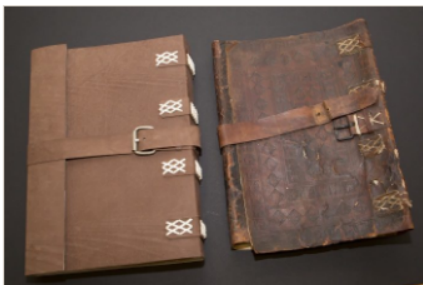
Hauptbuch des Dammschen Beginenhaus nach und vor der Restaurierung (G V 9:1)

Im Stadtarchiv Braunschweig wird das kulturelle Gedächtnis der Stadt gehütet. Unsere Aufgabe ist es, das schriftlich überlieferte Erbe der Stadt zu bewahren, es unseren Besucherinnen und Besuchern sowie der internationalen wissenschaftlichen Forschung zugänglich zu machen und es für künftige Generationen zu erhalten. Einige der Schätze, die sich im Archiv befinden, haben durch Lagerung und Benutzung im Laufe der Jahrhunderte Schaden genommen und zeigen u.a. folgende Alterungserscheinungen: Das Schriftgut ist von Mikroben oder Tintenfraß befallen, Akten enthalten säurehaltiges brüchiges Papier, Buchrücken und Aktendeckel sind eingerissen oder haben sich ganz abgelöst. Nur eine professionelle Restaurierung kann die Einflüsse der Zeit stoppen.