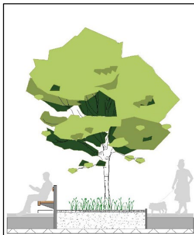
Systemschnitt, mit Sitzgelegenheit