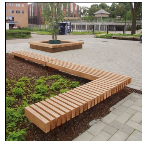
Beispiele für Sitzgelegenheiten