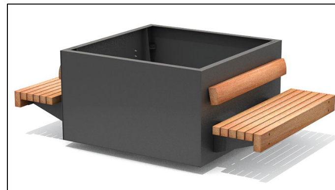
Beispiel für Grundmodul Pflanzkübel mit Sitzgelegenheit (Quelle: Streetlife, Serif Hug a Tub, anthrazit)