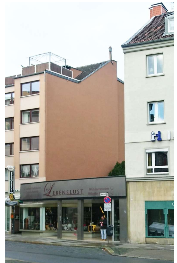
8 Marstall 2