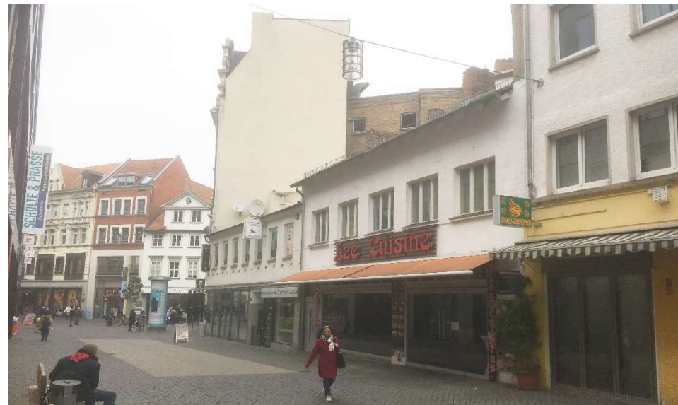
5 Kattreppeln 2-5