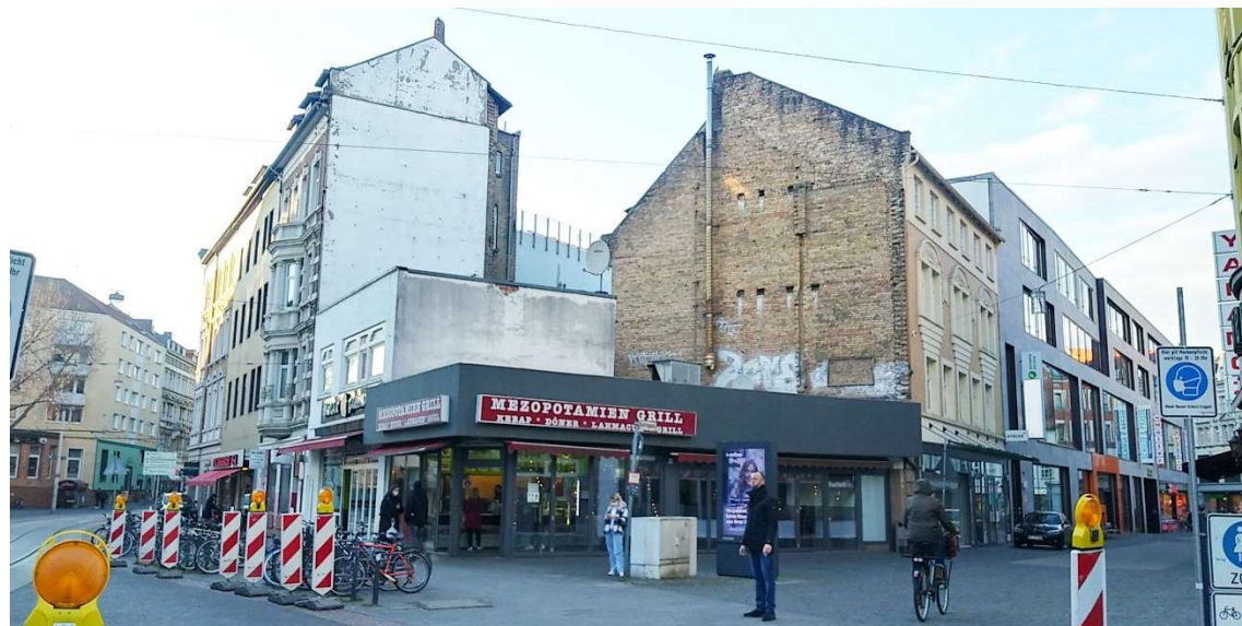
3 Kattreppeln 14