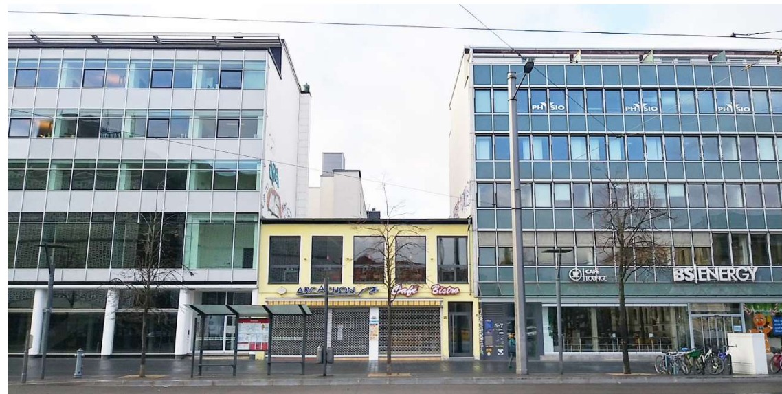
2 Bohlweg 3