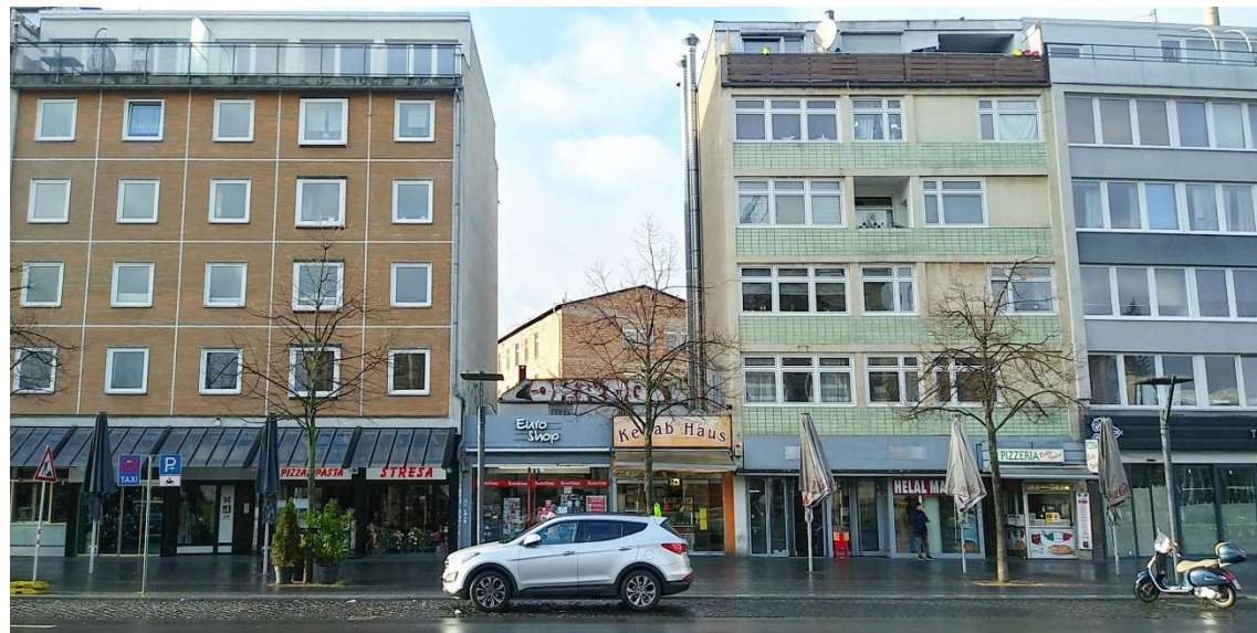
1 Bohlweg 15