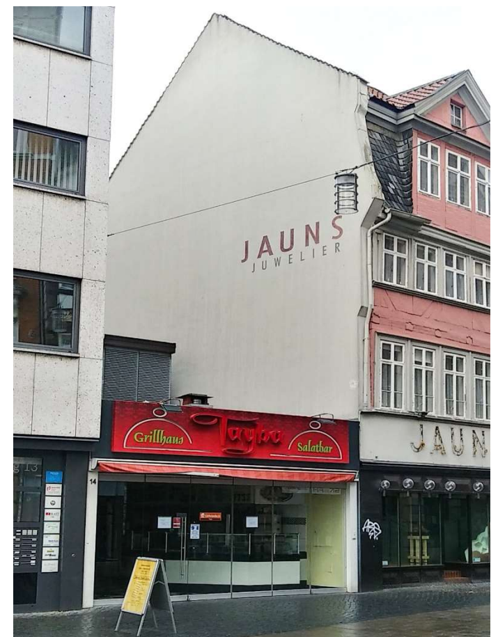
6 Vor der Burg 14