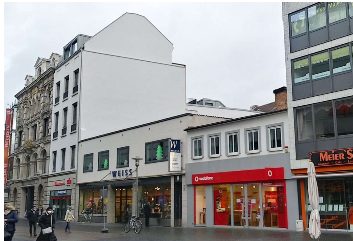
7 Sack 21 + 23