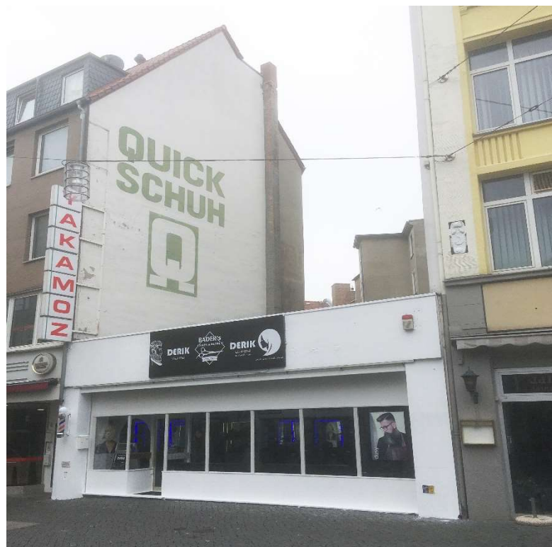
4 Kattreppeln 12