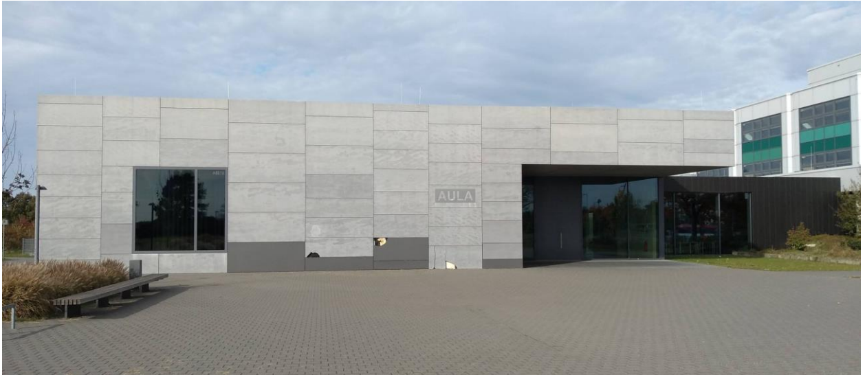
Neue Fassadenschäden – Fotos vom 17.10.2022