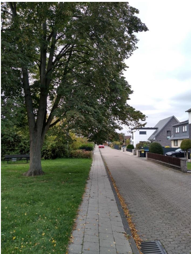
Blick in den Zeisigweg nach Westen