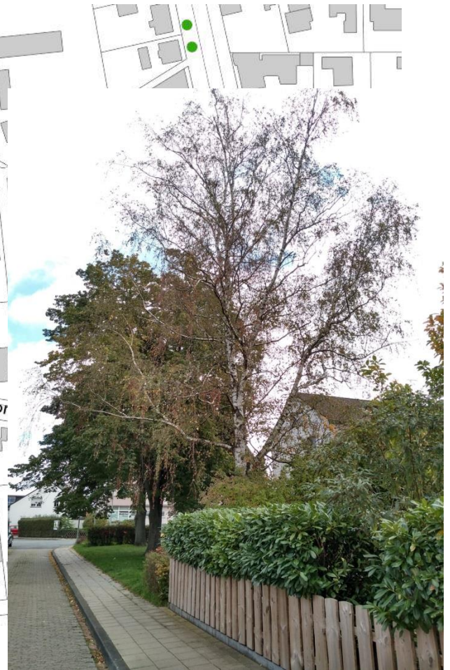
Blick in den Zeisigweg nach Osten