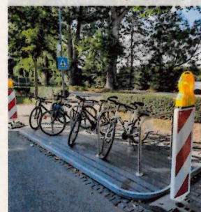
Fahrradflunder (Beispiel Bild)