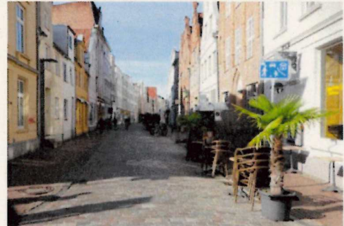
Referenzbeispiel für gesägtes und neu verfugtes Pflaster - Lübeck Fleischhauerstraße

Stadt Braunschweig, Quartiersentwicklung Magniviertel