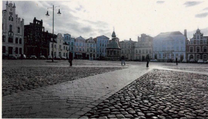
Referenz Altstadt Wismar

sollten die zwei Probeflächen gestalterisch und funktional überzeugen, könnten weitere Straßenabschnitte bzw. Platz- bereiche im Magniviertel sukzessive folgen.