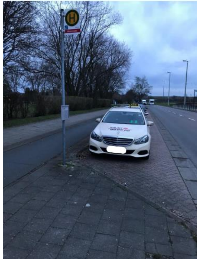
Bus-Haltestelle (Blickrichtung Süden)