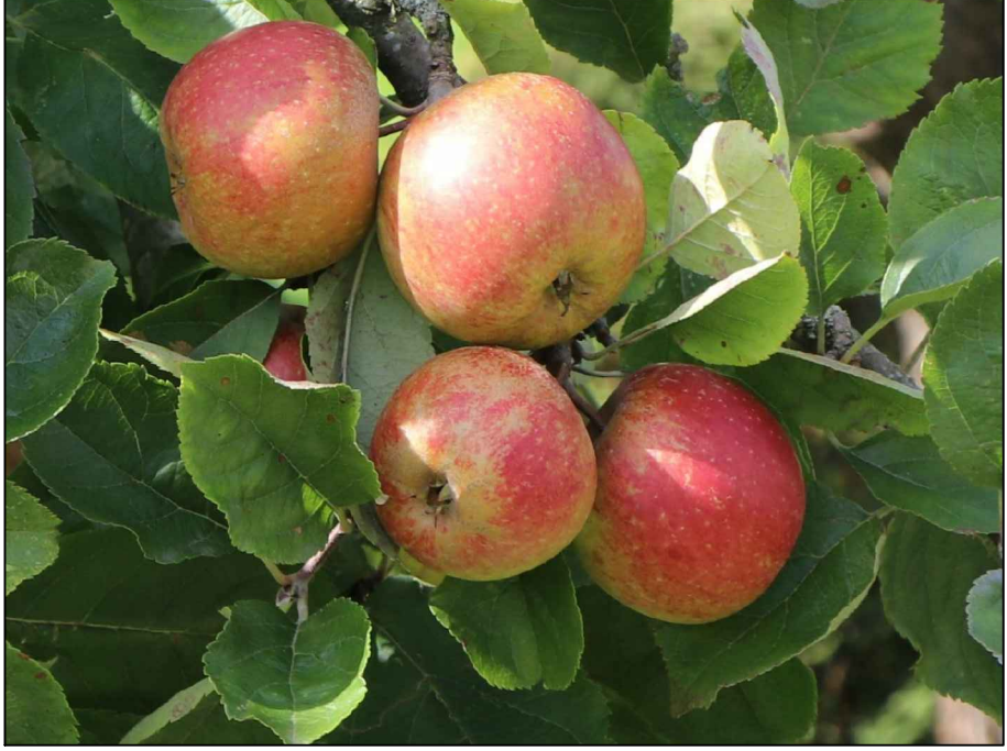
Beispielfoto Winterapfel 'Schöner aus Boskoop', Frucht