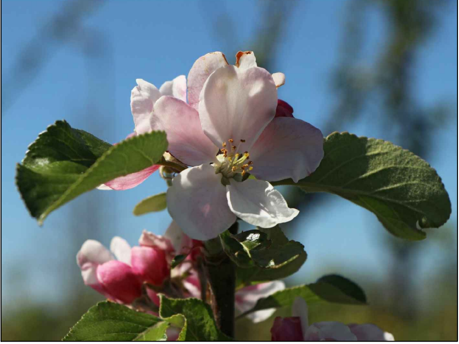
Beispielfoto Sommerapfel 'James Grieve', Blüte