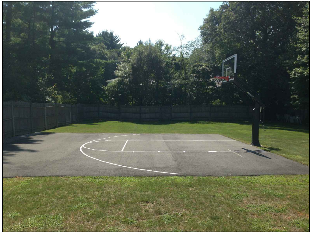
Beispielfoto Asphaltbelag mit Linierung