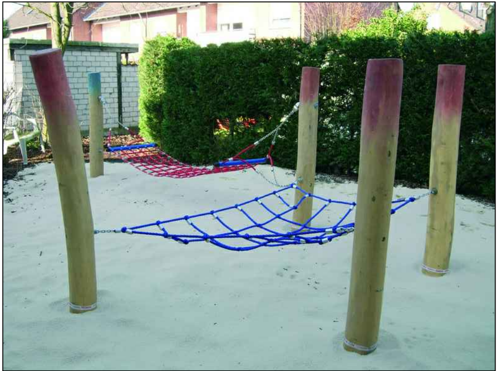
Beispielfoto Liegenetz mit Hängematte