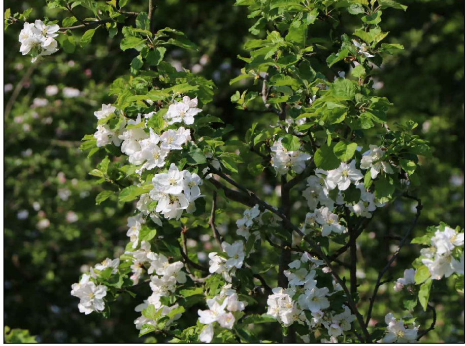
Beispielfoto Winterapfel 'Schöner aus Boskoop', Blüte