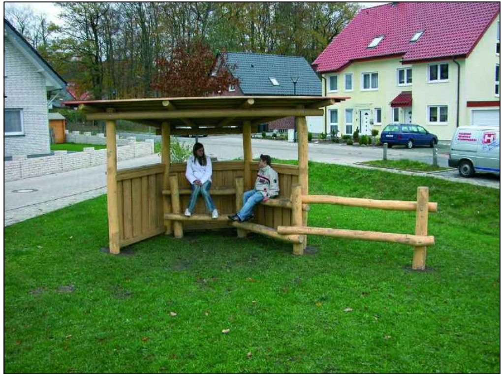
Beispielfoto Jugendtreff