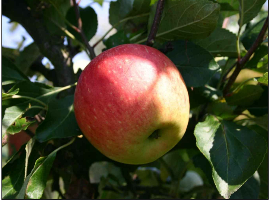
Beispielfoto Sommerapfel 'James Grieve', Frucht