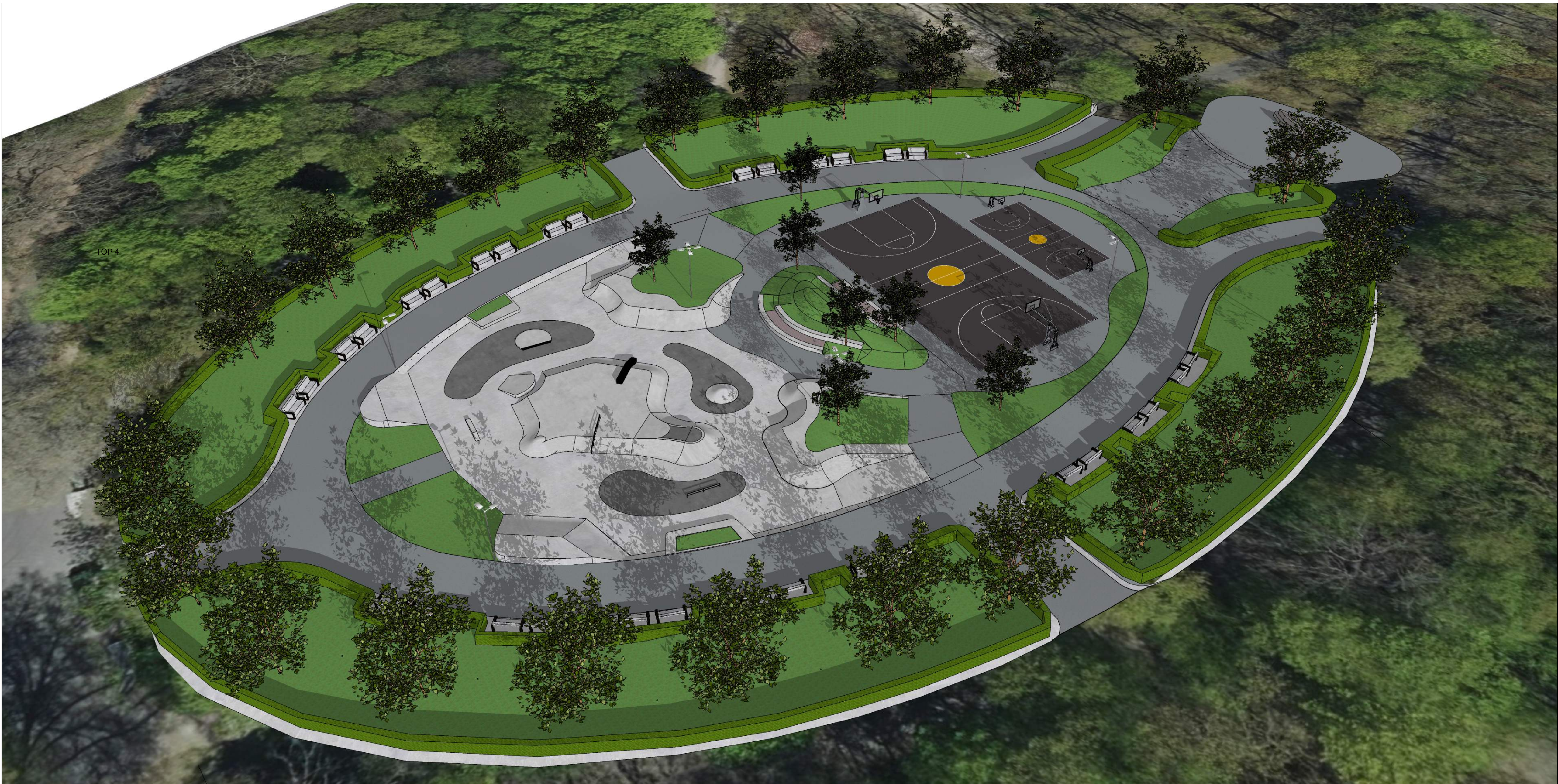
3D Ansicht Skatepark