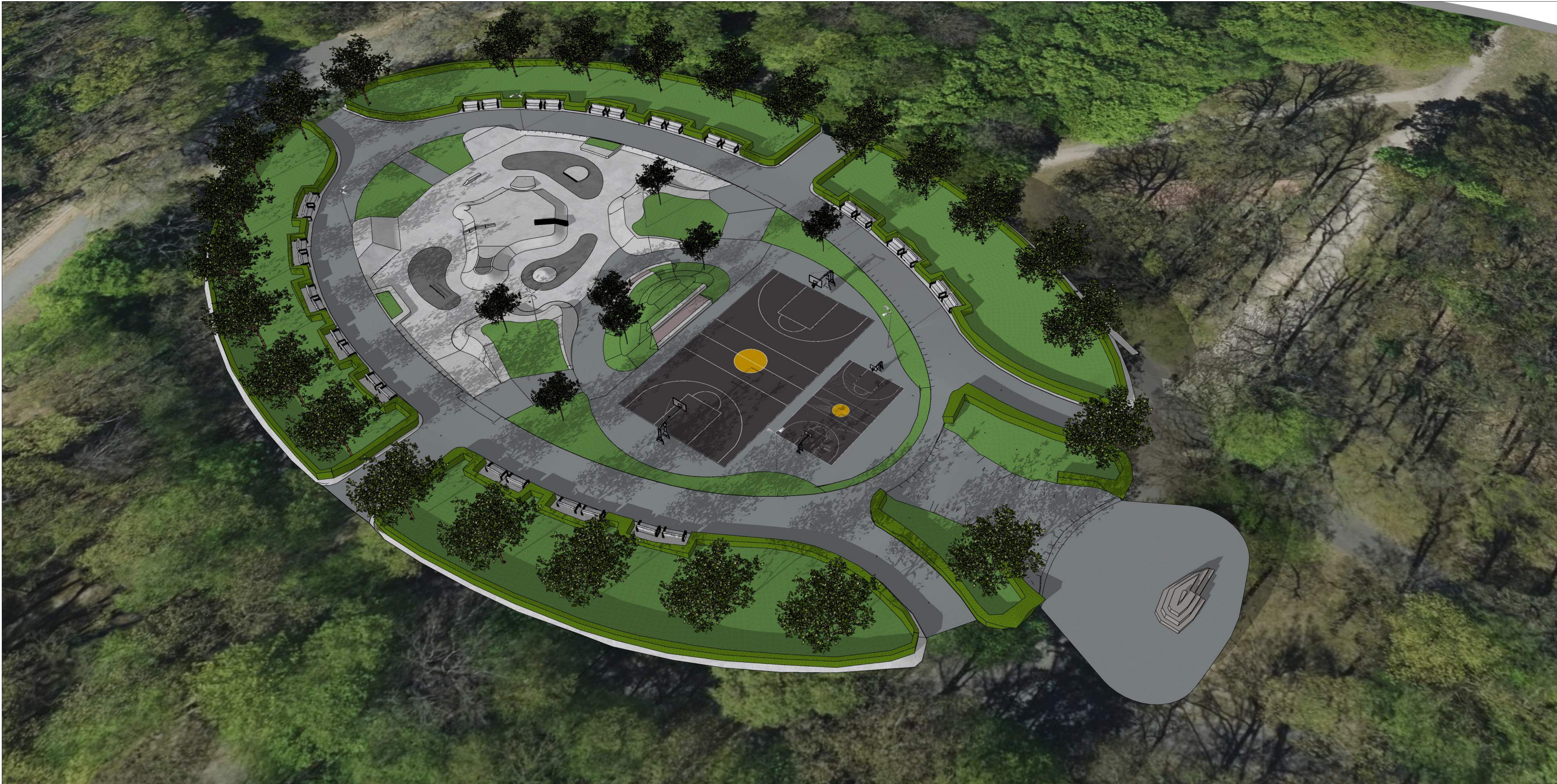
3D Ansicht Skatepark