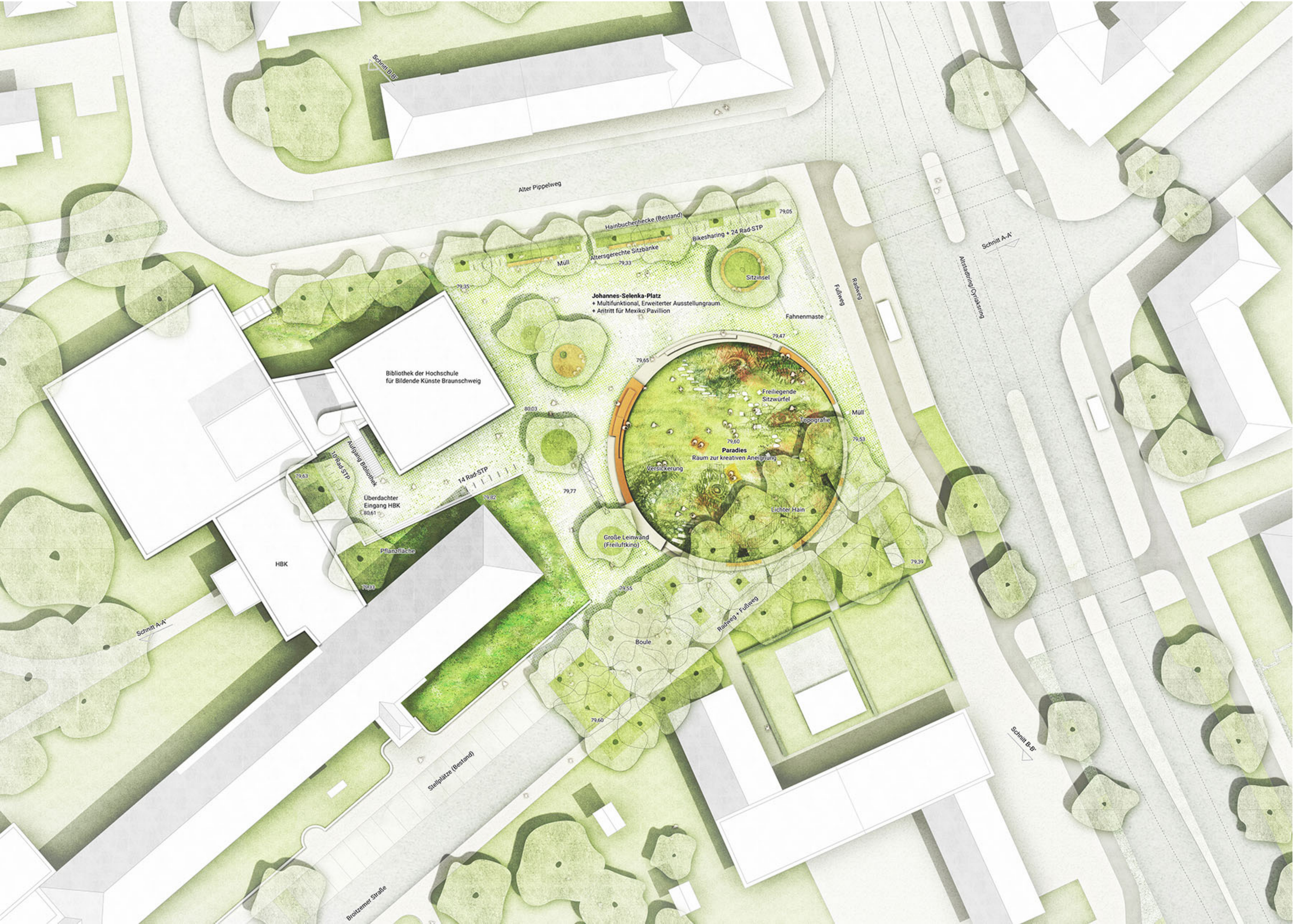
Anlage 1: Siegerentwurf „Johannes-Selenka-Platz“ _Lageplan