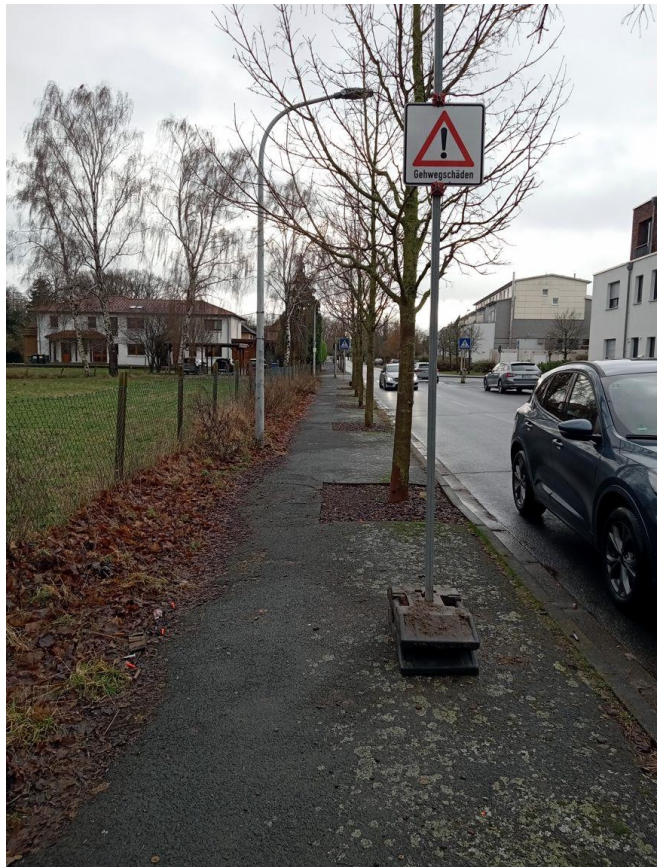
Gehweg ggü. Haus Nr. 18a – Blick nach Süden