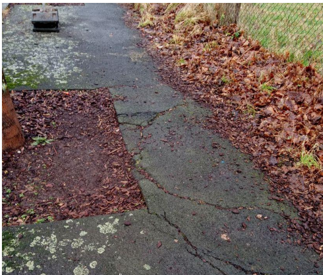
Schaden-Details ggü. Haus Nr. 17