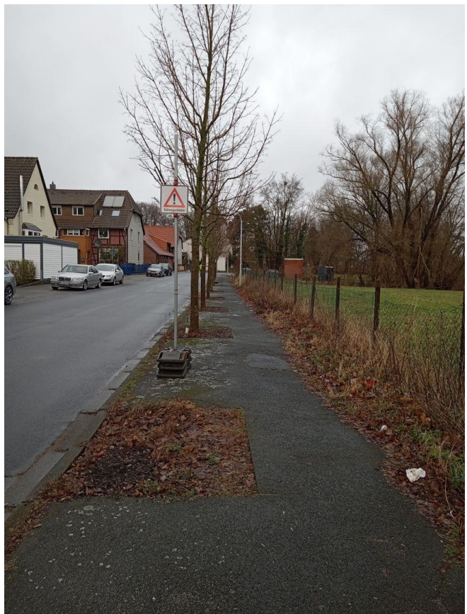
Gehweg ggü. Haus Nr. 17 – Blick nach Norden