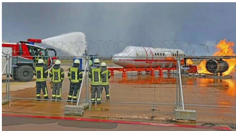
Löschübung am Flughafen BWE