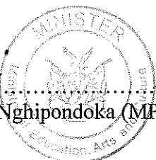
Ester Anna Nghipondoka (MP) Minister