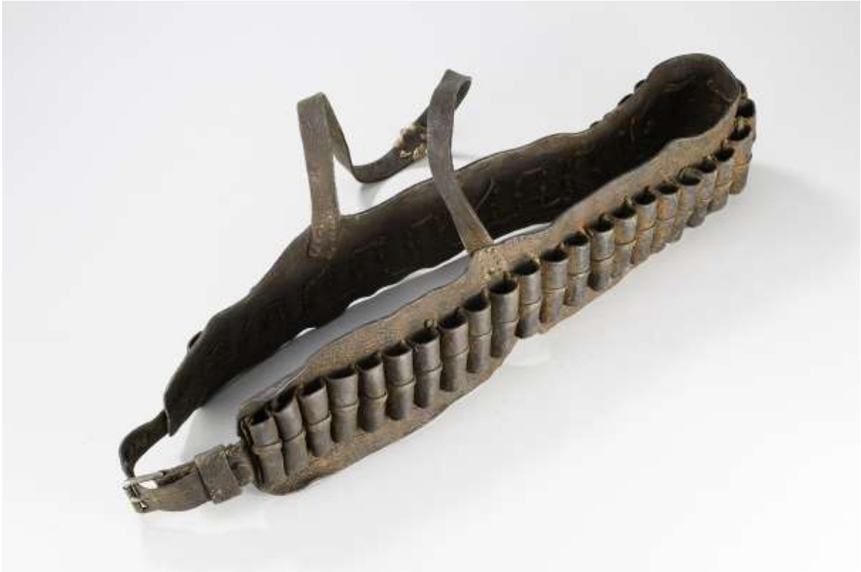
Patronengurt des Kahimemua Nguvauva, ca. 1850 Städtisches Museum Braunschweig