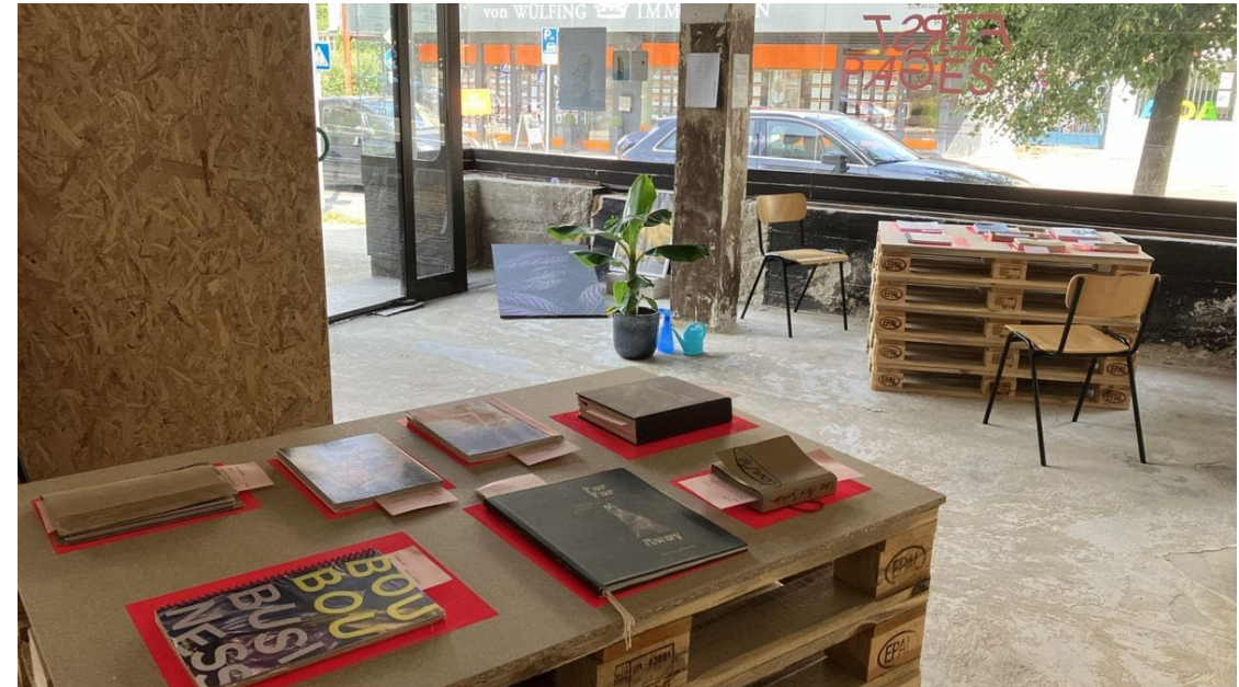
Bookstore im Leerstand, Braunschweiger Zeitung vom 18.07.2023