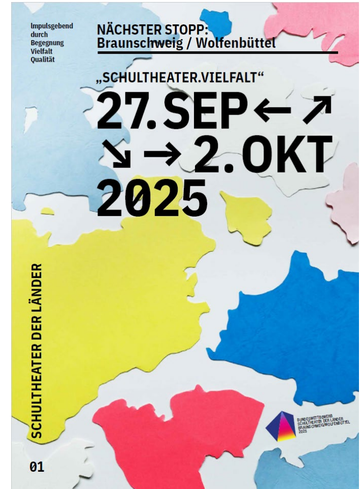
Layout Broschüre „Schultheater der Länder“ 2025