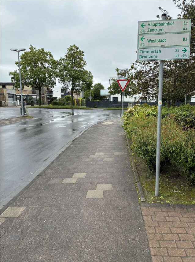
1. Weserstraße Blickrichtung Illerstraße