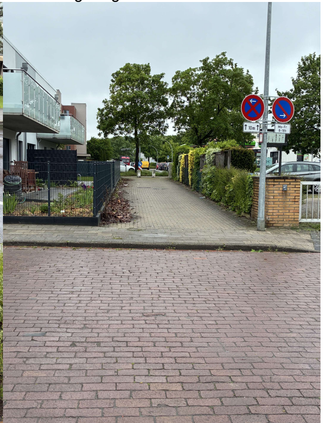
4. Bordstein am Ende Illerstraße am Haus 54