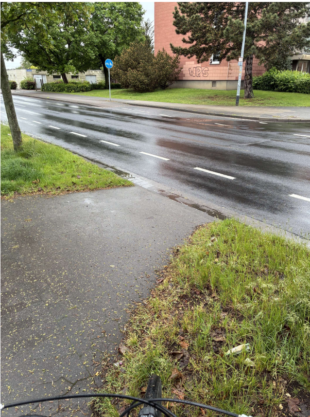
3. Absenkung Richtung Lichtenberger Straße