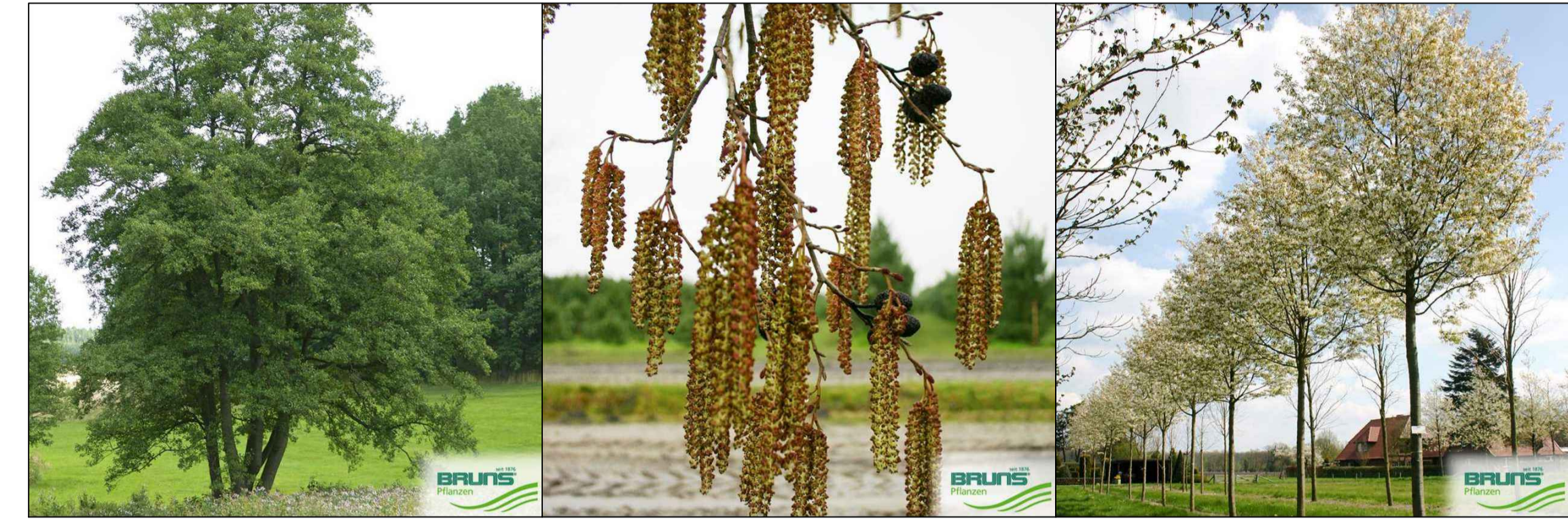
2a - Alnus glutinosa (Schwarz-Erle) 2b - Alnus x spaethii (Purpur-Erle) 3 - Amelanchier arborea 'Robin Hill' (Schnee-Feisenbirne)