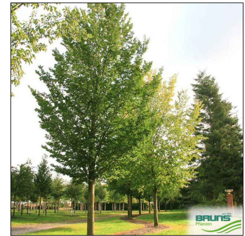
8 - Ulmus 'Lobel' (Ulm)