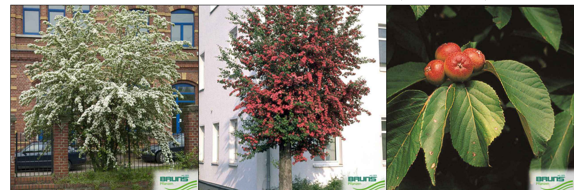
4a - Crataegus laevigata (Zweigfingiger Weißdorn) 4b - Crataegus laevigata 'Pauls Scarlet' (Echter Roldorn) 5 - Malus tschonoskii (Woll-Apfel)