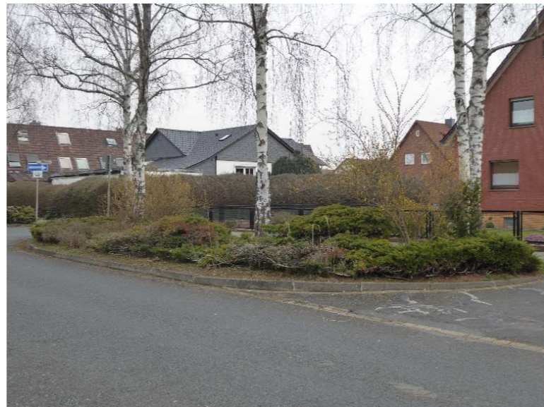
Im Rübenkamp; neu: Rasenfläche unter Bäumen