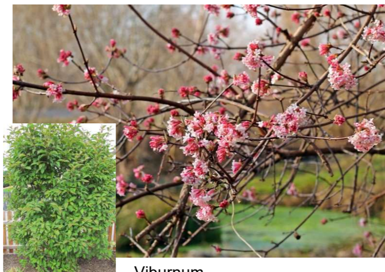
Viburnum bodnantense 'Dawn'