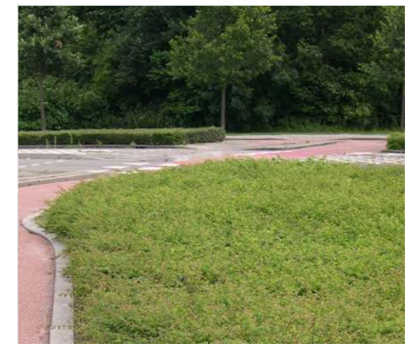
Symphoricarpos chenaultii 'Hancock'