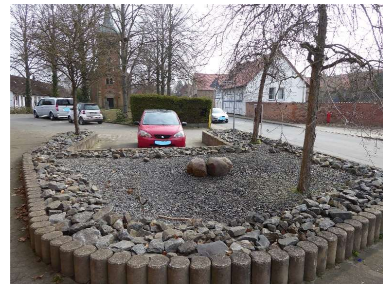
Vor der Kirche neu: System- staudenpflanzung