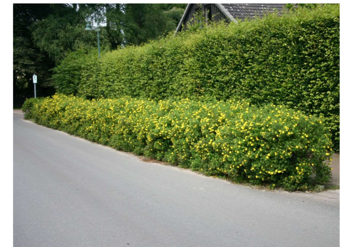
Potentilla fruticosa 'Darts Golddigger'