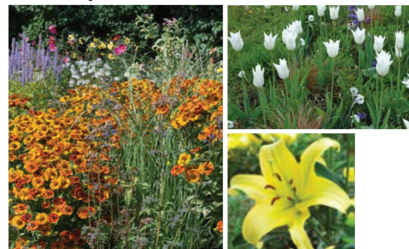
Verver Tram Vivas 'Esmeralda'