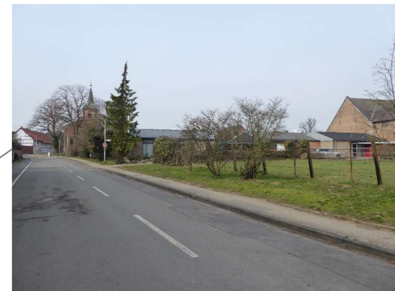
Fischerbrücke, neu: Solitärsträucher auf Rasenfläche

Ersatzpflanzungen zum Ausgleich des Substanzverlustes aufgrund der Haushaltskonsolidierung in bezirklichen Grünanlagen des Stadtbezirkes 211 67.21 SG 6, Stand 18.08.2021