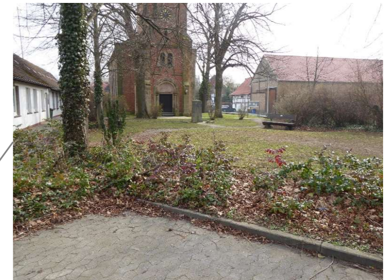
Vor der Kirche neu: Rasen und Bodendeckerpflanzung