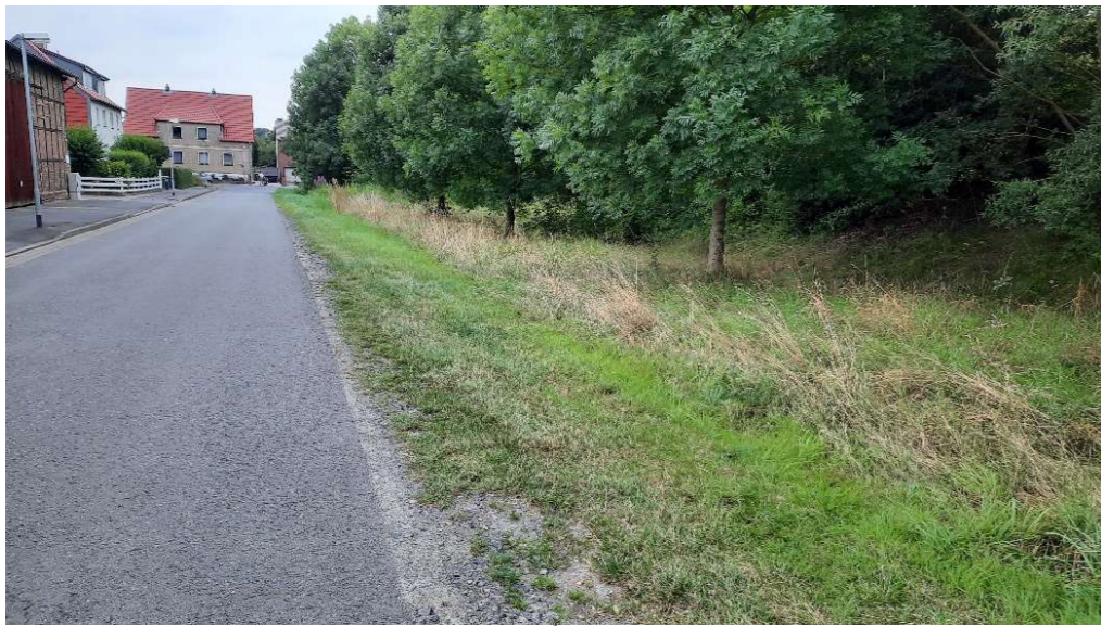
Thiedebacher Weg; neu: Blühstreifen