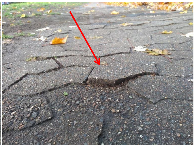
Detailfotos einiger Gefahrenstellen