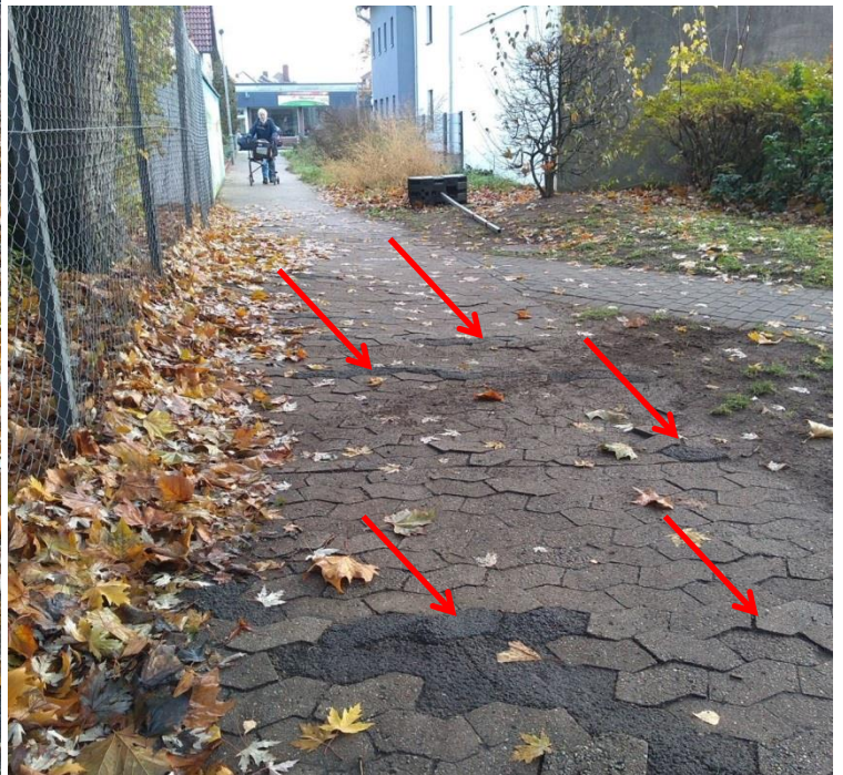
Blick zur Hauptstraße