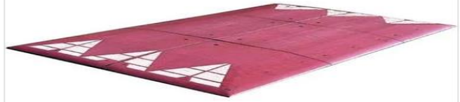
Berliner Kissen Komplett-Set, 3000 x 1800 x 65 mm, <,30 KM / H, R...

2.887,65 € centralbestellung.de 185,00 € – Lieferservice