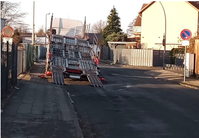
Samstag, 20. Januar 2024, 09:51 Uhr