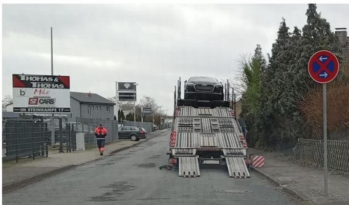
Montag, 05. Februar 2024, 12:07 Uhr