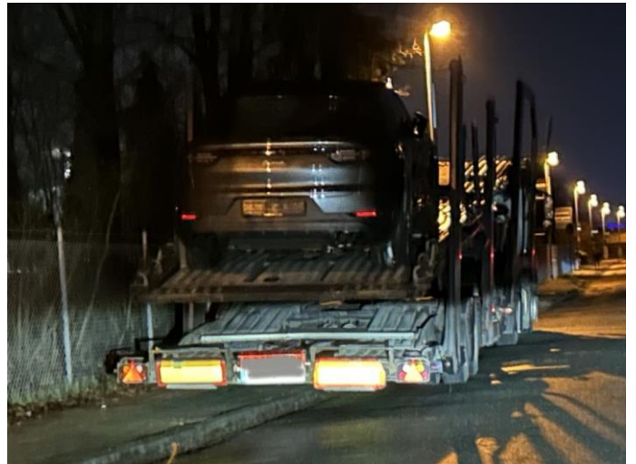
Montag, 12.02.2024, 19:52 Uhr