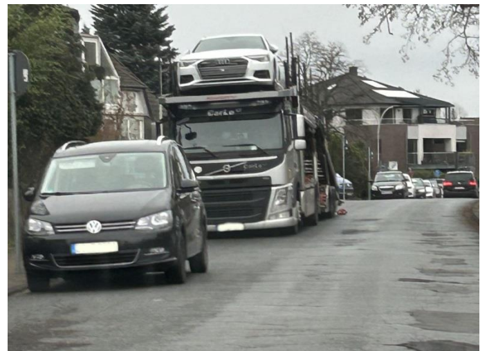
Donnerstag, 15.02.2024, 08:28 Uhr