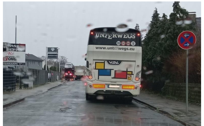
Mittwoch, 14. Februar 2024, 08:33 Uhr