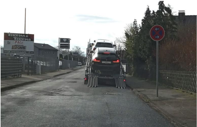
Freitag, 09. Februar 2024, 14:24 Uhr

Hinweis: Alle Fotos sind bei Zufallsbegegnungen entstanden und stellen nur eine kleine Stichprobe aus unzähligen Ladevorgängen im Zeitraum von Mitte Januar bis Mitte Februar 2024 dar.