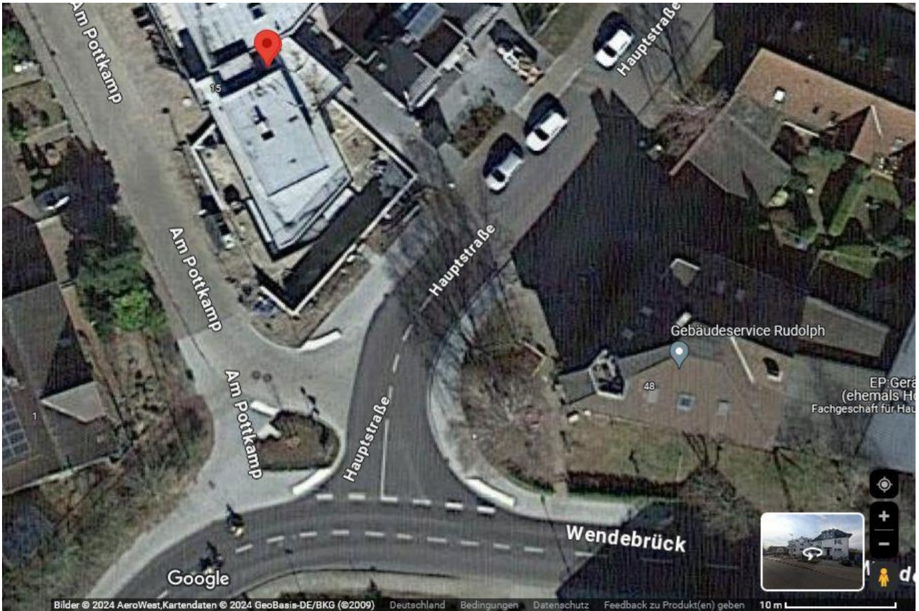
Luftbild Hauptstraße/Pottkamp und Umfeld

Situation auf der Hauptstraße aus Richtung Norden kommend kurz vor der Einmündung „Am Pottkamp“