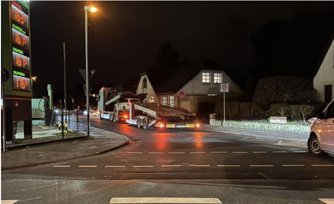
Dienstag, 16. Januar 2024, 18:35 Uhr