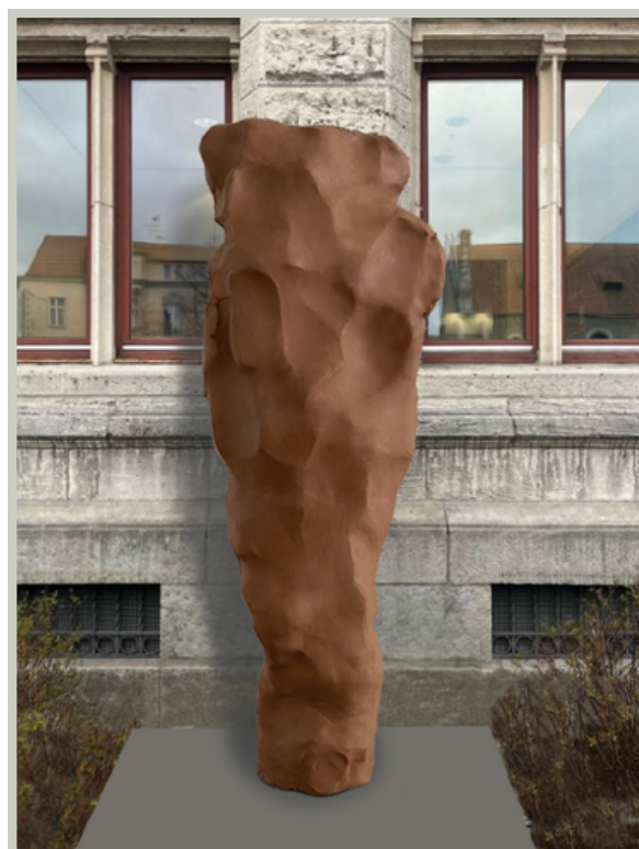
Platz 4: Thomas Rentmeister