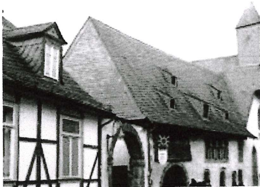
Gebäude „Großes Heiliges Kreuz“

Im Obergeschoss in einem weiteren Seitenflügel des Gebäudes der 1230 erbauten Kemenate ist die vom Hof aus zugängliche Sammlung zur Geschichte des Goslarer Jägerbataillons zu sehen. Diese Ausstellung gilt als das Militärgeschichtliche Museum der Stadt Goslar.