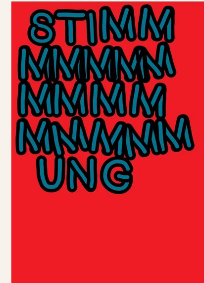
Nachwuchs & HBK

Die halle267 bekommt kuratorische Kontinuität, Vermittlung und verlässliche Produktionslogik.